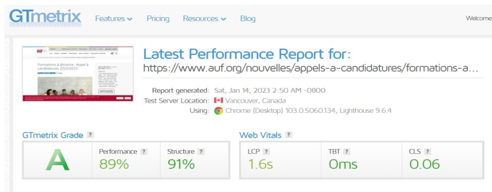
Figure n° 3 : résultat d'évaluation du site AUF

Le second site soumis à la même évaluation et aux mêmes conditions d'utilisation est celui de l'Agence Universitaire de la Francophonie AUF en sigle https://www.auf.org .